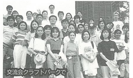
交流会クラフトパークで