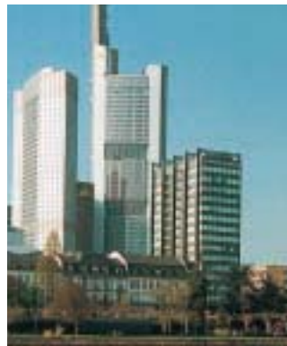
フランクフルトの金融街を背景にマイン川河畔で

銀行は銀行で通貨単位の変換の混乱に銀行員が待機しているという話を聞き、何が起ころかわからないという2000年のY2K並みの緊張感を先にフランクフルトで経験したような気がします。99年になって、1週間は銀行口座引き落としによる振り込みは、順調にいきませんでした。また政治的には、99年は、16年間という長いCDU政党のコール政権から、SPD政党のシュレーダー政権の交代の年でもありました。選挙運動でフランクフルトのレーマー広場に来たコール首相の演説を聴きに行ったのも、今となれば懐かしい思い出です。フランクフルトはリンゴワインの名産地ですが、リンゴワインを飲みながら、市民が政治家の演説を熱心に聞く姿には、ドイツ人らしい演説好きが感じられました。フランクフルトは、世界各国の人達が集まった町で、なかには、母国では戦争している国の人達も互いに生活をしていきます。その意味でも、住民の関係の複雑さをひっくるめていう町でした。日本を一步でると個人主義という言葉が人を支配しているような複雑さを思い起こします。