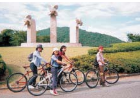
Summer tour '99 ~山鹿~