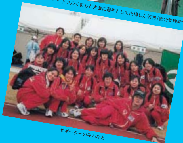
サポーターのみんなと