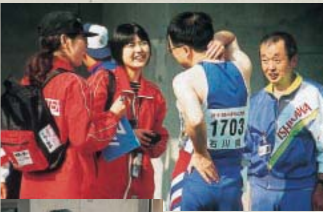
ハートフルくまもと大会 (H11.11.6-11.7) にて (選手と本学学生)