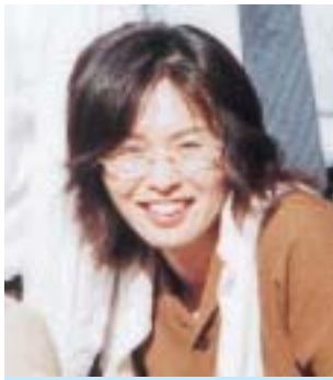
平成10年度卒(文学部英語英米文学科)