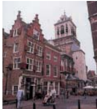
右奥はデルフト市役所で今でも行事に使用。手前は骨董店。

98年秋から、オランダで高齢者の住環境を学んだ。その合間を縫って、いろいろな建物を夢中で見てまわった。