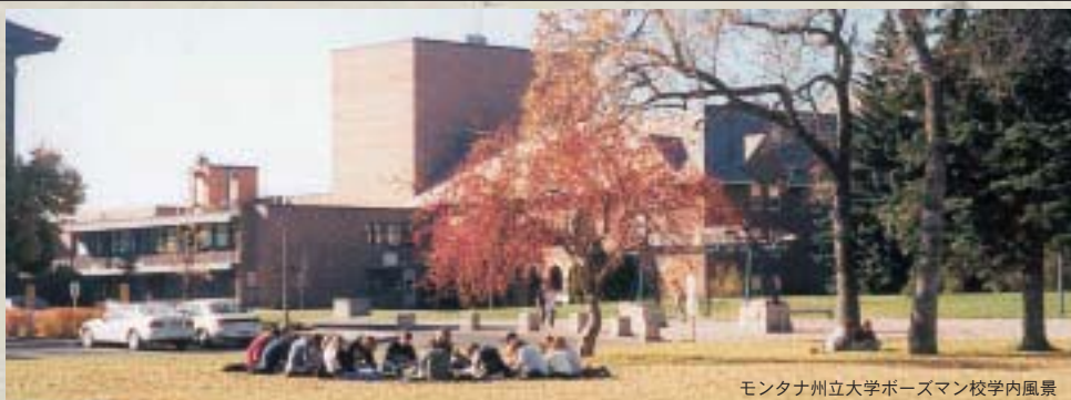
モンタナ州立大学ボーズマン校内風景

す。この学生は日本の学生、少なくとも県立大の学生よりもずっと勉強しています。図書館は研究したりレポートを書いたりする学生でいつもいっぱいです。そして、アメリカ人の学生と同様、この留学生もまた毎日夜中まで勉強しており、3〜4時間しか寝ない時間がある人もいます。最初は、全ての留学生が寝ないで勉強すべきでみんなそうしているのだと思っていました。しかし、あとになってそれは真実ではないとわかりました。今私はほとんど毎晩8〜9時間寝ています。夜寝るために、昼間、昼食時も一生懸命勉強しているのです。ここにはたくさんのお客の学生がいて、勉強するかわりによく一緒に集まっておしゃべりをしていきます。それがあまり睡眠をとれない一因だと思います。十分な休息をとることは、ここで健康を維持するのにとても重要なことです。