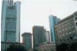
フランクフルトの金融街

大学での研究生活では、日本の大学とは違ったシステムを味わうことができました。多くの助手、秘書をもつドイツの大学教授の研究室のなかでの生活は、毎日緊張感がありました。日頃の講義の他に、ときにはブロックゼミナールという1週間の合宿による研修が開かれます。この研修への参加では、教授と助手、ドイツ学生の間で活発な議論が飛び交う情景を思い出し、議論好きでドイツ気質がみなぎったゼミナールを経験しました。仕事の手を休めて、一年間のドイツでの生活を思い起こしながら、もう一度、あのような経験ができればと、あれやこれやと過ぎ去ったつかの間の思い出にふけています。