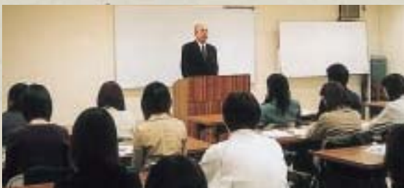
福岡コース (株博多大丸にて)

本学では、就職支援事業の一つとして企業見学会を実施しています。これは、3年次の就職活動本格化の前に、企業活動の現場を訪ねて現場の雰囲気を感じ、企業の経営方針・業界内容や業界の現状等の説明を聞くことにより、企業活動の実態を知り、自分にあつた業種・職種・企業探しの参考とすることを目的としています。今年度は、平成12年1月14日に福岡コースと熊本コースの2コースで実施、それぞれ約30名の学生が参加しました。