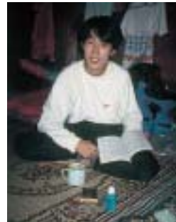
調査キャンプにて

地球上のあらゆる群系の中でも、 つとも高い地上部現存量を蓄え、 多様性の宝庫と喩えられるほどの