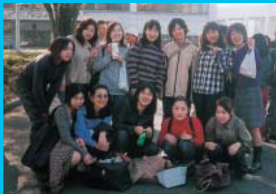
県立大学学生である現在（前列左から2番目）