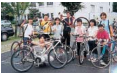
三大学連盟サイクリング ー合同キャンプー

サイクリング部では、「自転車を楽しむ」という共通意識の下で、個人が自分に合った活動をしています。毎週土曜日、10km〜20kmほどの軽いサイクリングを楽しみ、夏のツアーや熊本市内の他大学との交流も行っています。また、個人や仲間内でレースに参加する人々もおり、数々の成績を残しています。 最近になり、ホームページを開設し、学内外のより多くの人に情報提供を行っています。 ( http://www.pu-kumamoto.ac.jp/~g0973297/top.htm )