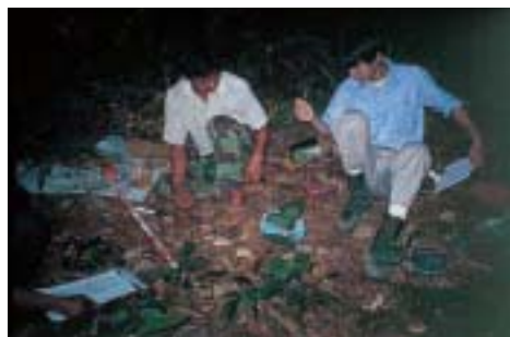
フネミノキの現存量調査