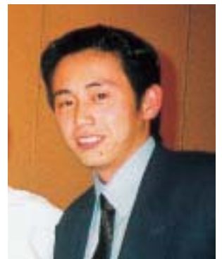
平成9年度卒(総合管理学部総合管理学科)

熊本県立大学を卒業して、早、2年が過ぎようとしています。私は現在、富合町役場に勤務し、住民課の国民健康保険係で先輩方に支えられ、多くの住民の方と接しながら、学ぶことの多い社会人生活を送っています。 1年目は、仕事の内容が全く分かっていなかったのですが、むしやりに、何とか乗り切ったという感じでしたが、現在は仕事の仕組みがだいぶ理解できるようになり、少しゆとりを持って取り組めるようになりました。 又、私は、小学校から大学まで柔道の柔道部のおり、現在は母校の中学後や休みの日に、生徒達と一緒に柔道の練習に汗を流しています。私にできることといたたら柔道ぐらいために少しも貢献できたらいいなあと、思いながら帯を締めています。 私が大学生活から地域社会へと行動範囲の広がる中で、皆さんにアドバイスできることといえば、人間関係の大切さ、それと継続は力なり、友は宝なりということ。何か一つ一生続けられることがあつたら最高ではないでしょうか。試練を受けながらも、仲間がいたからこそ多くの喜びもあり、これまで成長できたように思えます。就職活動にあたって、先生方や、たのしい先輩、そして同輩からアドバイスを受け、助けられる中で、自分の目標を定め、頑張れたように思えます。 友人を大切にし、自分のポリシーを持って学園生活を送って下さい。