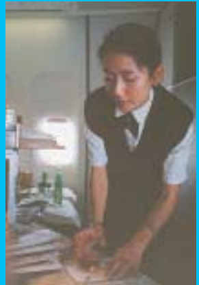
ルフトハンザドイツ航空の フライト・アテンダント時代

入学してはや1年、とても有意義な1年を過ごさせていただきました。私は一般の学生とは少し違って、社会人入学生として県大に入ってきました。高校卒業のとき、目標もなく、ただみんなが行くから私も大学へ行くというの嫌で、いちばん興味があつた服飾関係の専門学校へと進学しましたが、自分には才能がないと1年後にあつさり、辞めてしまいました。いま考えてみると、才能がないという前に、結局本当に好きなことではなかつたから途中で辞めてしまつたんだと思います。それからいろいろなことがあり、運命の糸に操られ、偶然にですけれど、自分にとつて天職だと思える仕事にも出会えました。けれど、出産、子育てと再びその仕事に戻ることは断念せねばなりません。子供を生んで育てることとは素晴らしいことです。自分が成長することです。しかし、女性にとつては人生を左右させられることでもあります。けれども人生どこかで諦めないことには、満足な人生を送ることが出来ないことを学びました。どんな環境におかれても、それを楽しむことが出来れば、人生何時でも薔薇色です。当面の目標は如何に定期試験を、楽しむかです。いくつになつても試験だけは、ちよつと憂鬱ですね。 この場をお借りしまして、諸先生方、いつも授業中うるさくて申し訳ありません。そして英文科の個性豊かなみんな、最高のクラスメートです。2000年も、みんな楽しんでいきましょう！