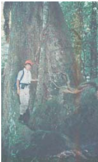
フタバガキ科植物の巨木

態学者に要求されている任務なのではなからうか。環境共生学部の一員として、熱帯雨林との共生を模索し、信頼に足る生態学的データを提供してゆくことが私の使命だと考えている。