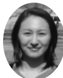
文学部 (平成17年3月卒業)