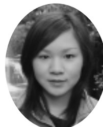
総合管理学部 (平成17年3月卒業)

客室乗務員になりたい、その思いを抱き入学したことを覚えています。夢であり憧れでもあった職業に就くことができた今、信じられない気持ちと努力して本当に良かったという気持ち、そして私の「客室乗務員になる」という目標達成のために、支えてくださった多くの方々に、感謝の気持ちで一杯です。 「なれるわけがない」、そう思い、何度も諦めようと思いました。自分に自信がなく、手の届かない、所詮夢にしかすぎないものだと思いついていました。ただ一つ、心に決めていたことは、「自分の可能性に限界があると決めつけたくはない」ということでした。やってみないのに、できないとは思いたくない、努力をできる限り続けられれば、先が見えてくるはずだと思い、目の前にあることから一つ一つ行動に移したことが、学生生活の中で自己成長につながったと思います。 失敗を繰り返しながら、努力が結果として出た今、夢を目標にかえ、達成するためには突き進んで来て本当に良かったと感じます。挫折しても、自分の可能性を信じ努力し続ける、そして周りの方々へ感謝の気持ちを忘れない、心に芯のある客室乗務員になります。