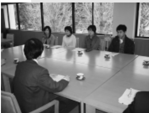
学生と学長の懇談会（平成17年2月開催）

新入生の皆さんが、このように元気な県大生の輪に加わって、その新鮮な感性をさらに豊かにし、伸びゆく力をさらに大きく伸ばされることを、期待しています。県立大学は平成18年4月の大学「法人化」に向けて学内外での検討を行っておりますが、皆さんの元気に応える教育をさらに進めることができます。