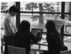
学生による食事バランス診断 12/19 実施