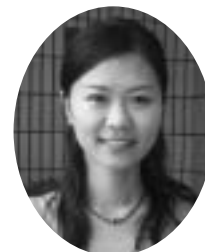
総合管理学部 (平成19年3月卒業)