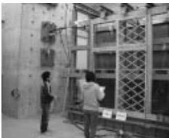
格子壁を対象とした加力実験

今後は、木造建物が本来の日本の住まいの持つ豊かさを保ちつつ、より安全なものとなるよう、研究を進めて行きたいと思っています。