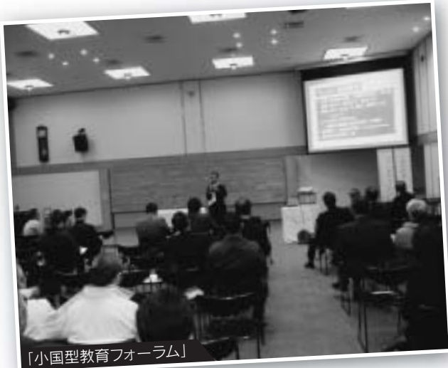
「小国型教育フォーラム」