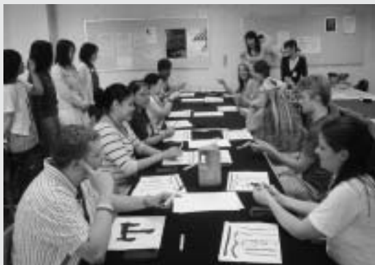
モンタナ州立大学ビリングス校短期研修団 平成17年来学時の様子

同校からの研修団の来学は、2年ぶり4回目。滞在中は、本学学生の家庭にホームステイをしながら本学に通い、日本語をはじめとする授業や日本文化体験、サークル交流プログラムなどを受講してもらう予定です。