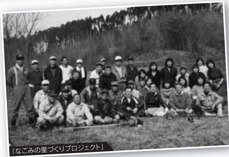
「なごみの里づくりプロジェクト」