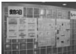
学生食堂内の食に関する情報提供