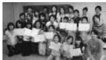
県大生による夏休み子ども作文教室

喜び、悲しみ、怒りなどの感情、価値観や人生観などの思考まで、すべてを言葉によって把握しようとしています。つまり、言葉の研究は、人間そのものへの理解に近づく道でもあるのです。