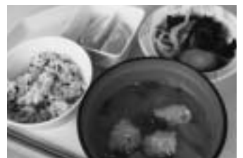
たこめし定食 1/23 実施