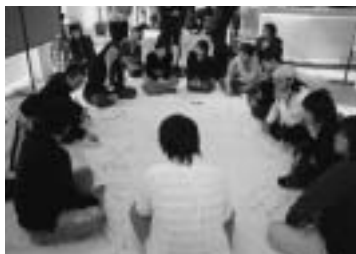
学生と講評者による建築談議