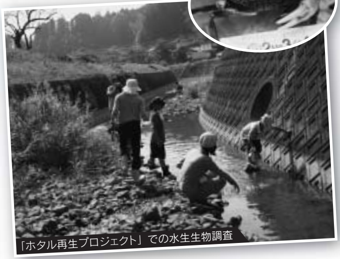
「ホテル再生プロジェクト」での水生生物調査