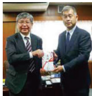
堤学長(左)と府高前後援会会長

※新入生へは、本学合格通知の際に、後援会の説明及び入会・会費納入のお願いをしております。まだ未入会の方は、充実した学生生活を送るためにも後援会事業をご理解いただき、是非ご加入ください。年次途中であっても随時入会を受け付けております。