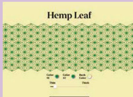
山田さんと「結(Yui)」の画面例