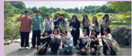
ボランティアの学生と水前寺成趣園を訪問

9月には、本学の学生が同じく4年ぶりに祥明大 サンミョン を訪れるなど、今後も活発な交流が期待されます。