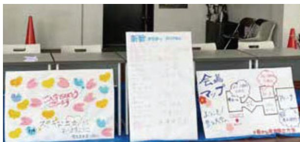
手作りの会場マップとプログラム