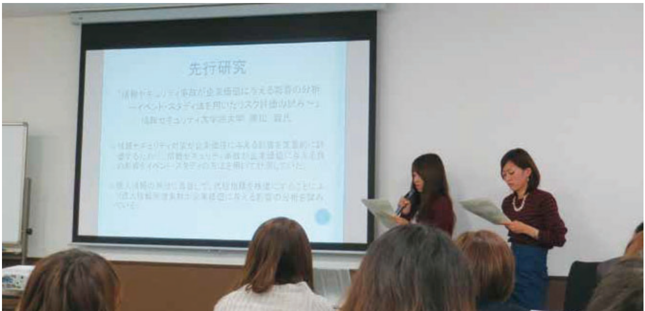
ゼミでは実証研究の指導を行っています。他大学との合同ゼミでの学生の研究報告の様子です。