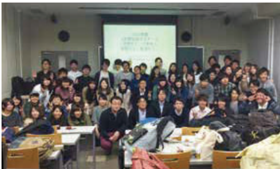
合同ゼミでの集合写真です。

例として、上記のイノベーション活動の研究では、日本企業の研究開発（R&D）投資への金融要因の影響を分析しました。より具体的には、新興企業のR&D投資における資本制約の有無をデータ分析により確認しま