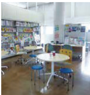
キャリアセンター内の様子

2022年に大学創立75周年を迎えたことから、後援会では創立75周年記念事業として学内キャリアセンターにパンフレットスタンド4台、丸テーブル3台と椅子4脚を贈呈しました。これは、就職活動に役立つガイダンスや進路相談等の就職支援を実施しているキャリアセンターを、より多くの学生に積極的に活用してもらうことを目的とした環境整備の一環です。また、後援会では、就職・進学活動のための写真撮影費用、資格取得及び学内外で開催される講座(対象とならないものもあり)の受講に対する助成により就職活動を支援しています。