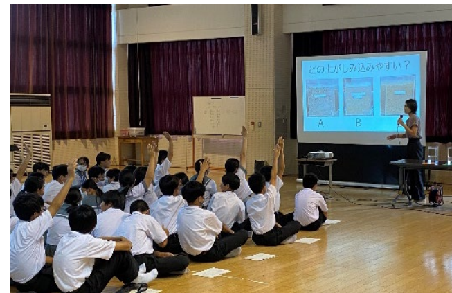
中学生を対象とした勉強会（R5.8）