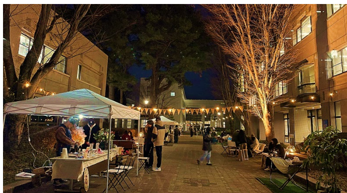
コミュニティづくり「県大マルシェ」