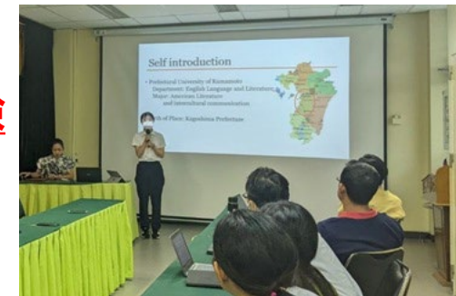
カンボジアでのインターンシップ