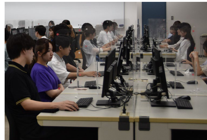
情報実習室での授業風景