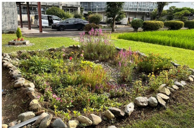
県立南稜高校に整備した雨庭