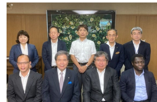
水銀研究留学生の受入れ