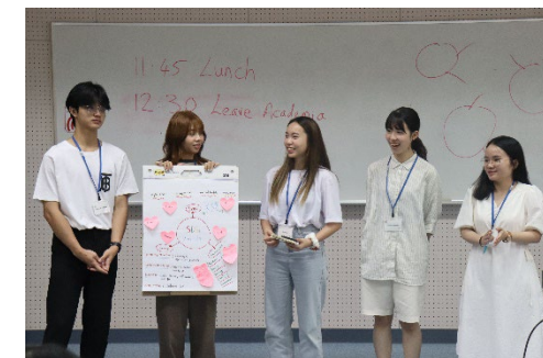
カセサート大学からの受入れ