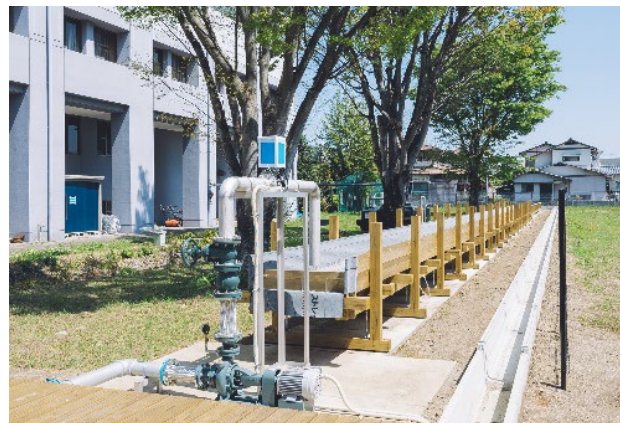
県立大学内に整備した国内最大級の実験水路